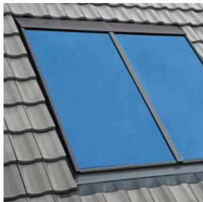
Installation solaire thermique (surface brute 4,26 m 2 ) pour les besoins d'une famille en production solaire de l'eau chaude sanitaire.

Du projet jusqu'à la mise en service. Du toit à la cave. Roto vous livre la solution complète. Capteurs thermiques, éléments photovoltaïques, raccords d'étanchéité, fenêtres de toit, technique de régulation et éléments de stockage compris. Ces systèmes sont éligibles aux crédits d'impôts et autres subventions régionales.