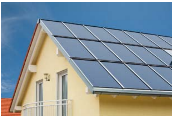
Le toit énergétique.

L'observation à long terme montre que Roto Sunroof ne réduit pas seulement vos frais. C'est un investissement rentable pour vous et l'avenir de la planète. Ne soyez plus dépendants d'une alimentation onéreuse et très fluctuante des énergies fossiles. Tournez vous vers le soleil. Nous sommes prêts à vous conseiller.